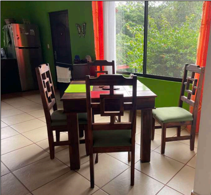
Área de Comedor (1)...