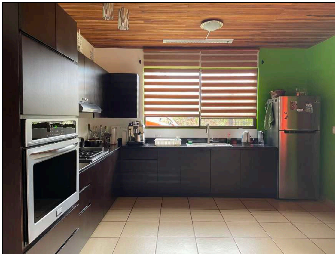
Área de Cocina (1)...